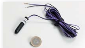
Temperaturføler. (Trådløs temperaturføler er under udvikling.)