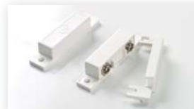
Dørkontakt (Trådløs dørkontakt er under udvikling.)